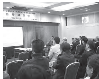
北広島支部: 新春講演会の会場のようす