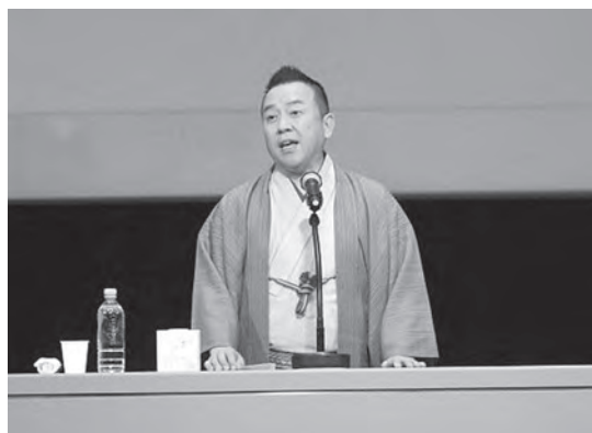
特別講演会：林家たい平氏

懇談会はパレスホテル大宮に会場を移し、世界大会でも入賞している子供たちのダンスチーム「VIOLET」のプロ顔負けのダンスに魅了されていた。