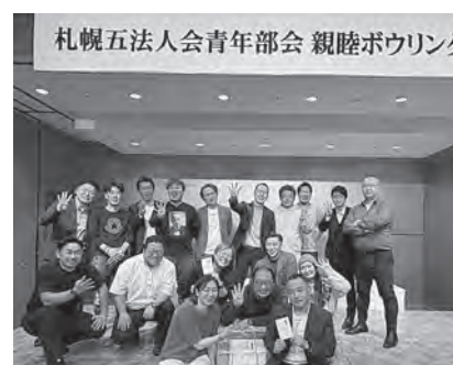
青年部会: 札幌5法人会ボウリング大会