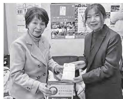
女性部会: ユネスコへ書き損じハガキ寄贈