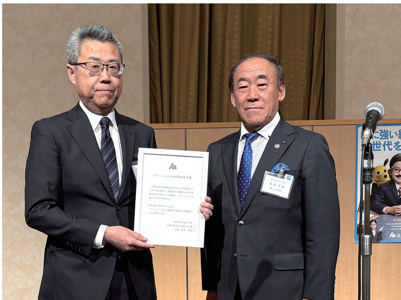
(令和8年度通常総会：キャッシュレス納付推進100%目指します！宣言書手交)