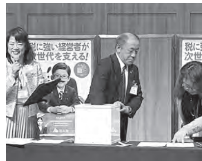
新年交礼会での福引のようす (本年担当女性部会)