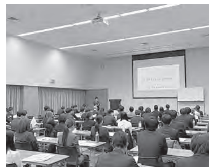
3月のビジネスマナーセミナー会場のようす